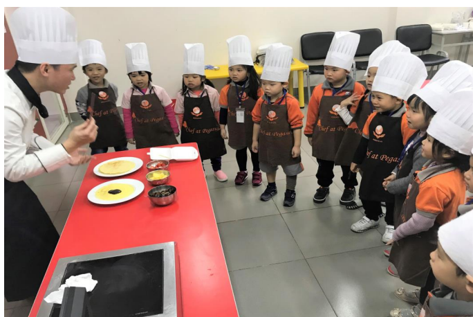
Học sinh mầm non lớp Jellyfish chăm chú nghe hướng dẫn từ chú đầu bếp.

Thông điệp từ Hiệu trưởng Chương trình Việt Nam Khôi Mầm non Kính chào Quý CMHS!