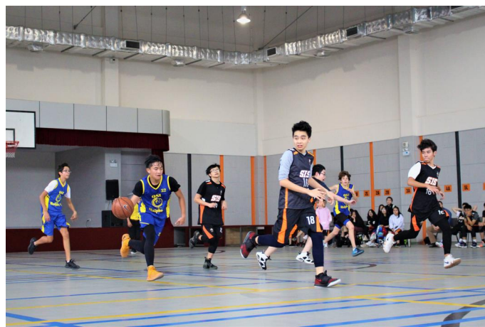
Các em học sinh tham gia trận bóng rổ giao hữu với đội QSI Hải Phòng