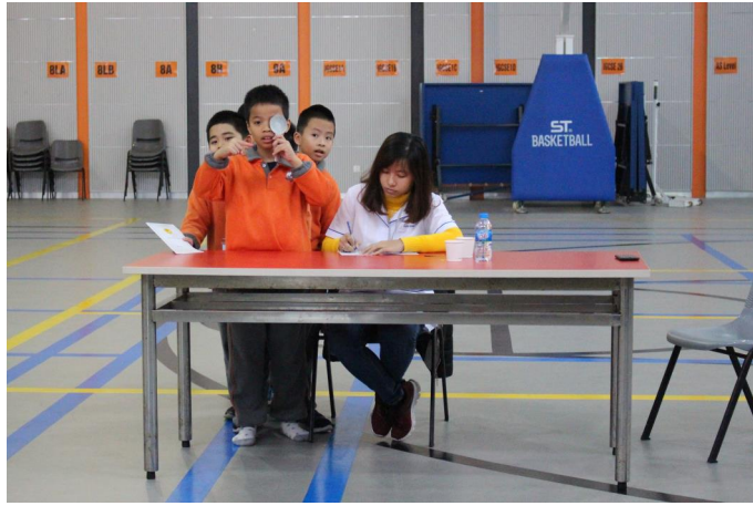
Đoàn Y tế Quận Hoàng Mai đến kiểm tra sức khỏe cho học sinh