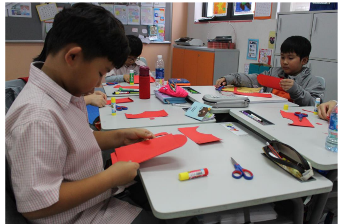
Các em học sinh lớp 3L làm phong bao lì xì.