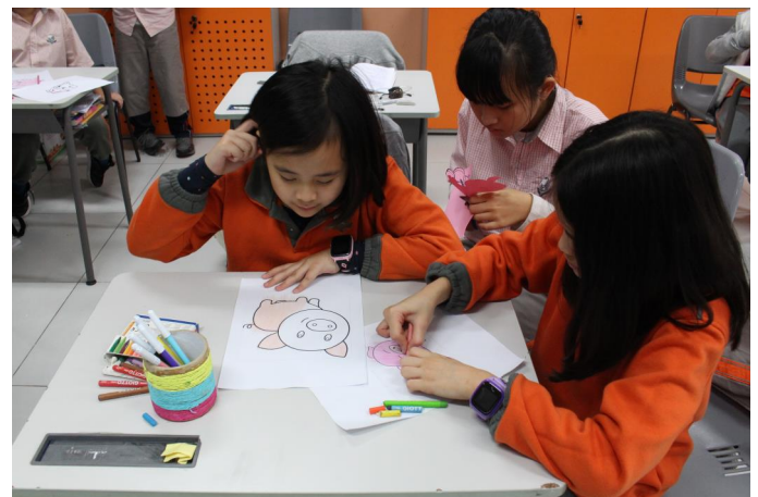
Rất nhiều bức tranh vẽ với chủ đề Tết đã được học sinh sáng tạo ra.