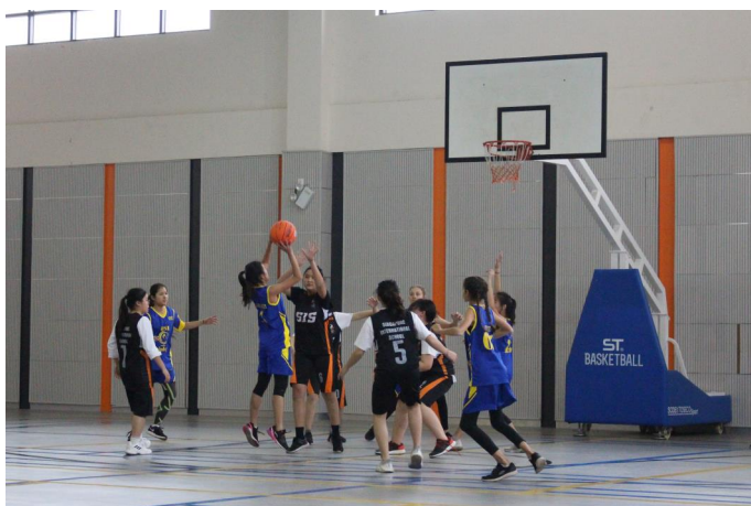
Trận đấu bóng rổ diễn ra gay cấn, thu hút rất nhiều học sinh.