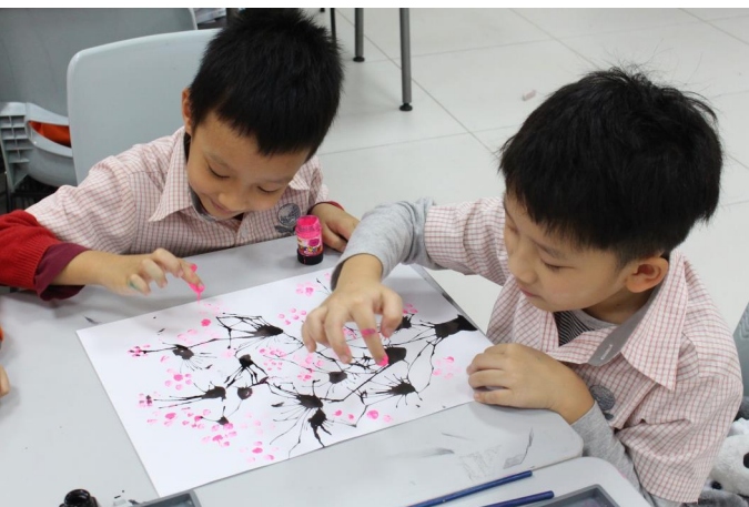
Học sinh lớp 2A vẽ bức tranh về cây đào ngày Tết.