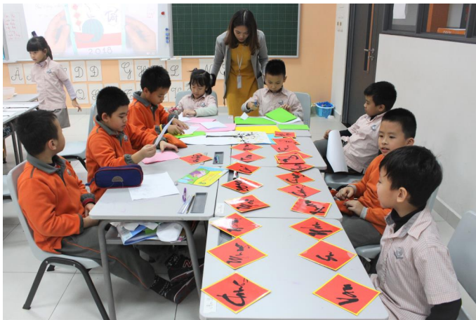
Học sinh chuẩn bị trang trí không khí Tết cho lớp học của mình