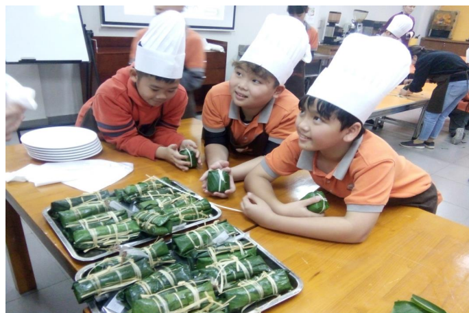
Nhiều lớp đã được trải nghiệm khóa học làm Bánh dày và giò tại PIU.