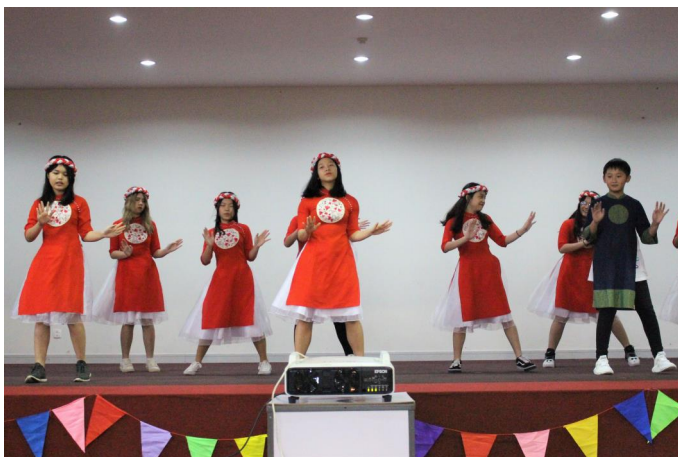
Các em học sinh tài năng của chúng ta tự tin biểu diễn bài hát với không khí Tết trong buổi sinh hoạt đầu tuần