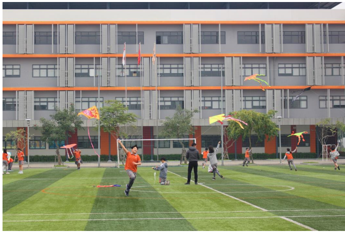
Các em học sinh luôn phấn đấu hết mình dù là trong lớp học hay ngoài sân bóng.