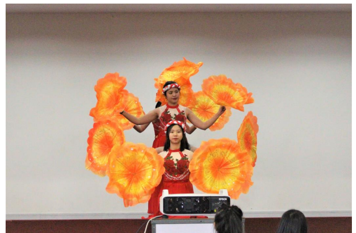
Các giáo viên tiểu học Việt nam biểu diễn điệu múa truyền thống Việt Nam.