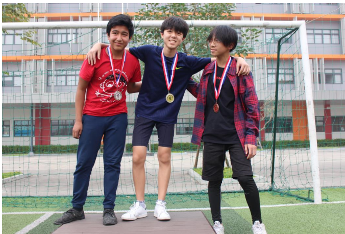
Ba trong số các em được nhận huy chương cho vị trí thứ nhất, nhì và ba của mỗi khối lớp