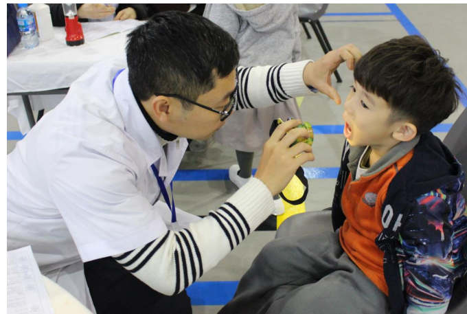
Học sinh SVIS được các bác sĩ kiểm tra sức khỏe.