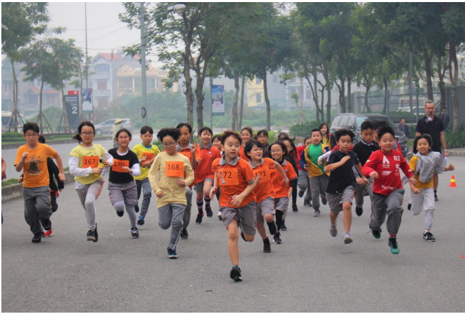
Các em học sinh tiểu học hứng thú tham gia Ngày hội thể thao