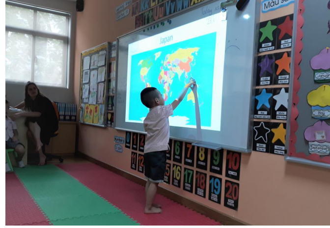
Các em học sinh KIK được mở rộng kiến thức về các nước trên thế giới

Về Hoạt động nhân đạo: Thực hiện nhiệm vụ năm học 2018-2019 của Sở GD&ĐT Hà Nội, hướng tới kỷ niệm 72 năm – ngày Thương binh liệt sĩ 27/7, ban Giám hiệu SVIS đã tổ chức tuyên truyền, vận động 100% GV & HS tham gia hoạt động Tri ân Thương binh tại Trung tâm điều dưỡng thương binh Duy Tiên – Hà Nam/TTTB , nhằm khơi dậy lòng yêu nước, ý thức vươn lên trong học tập của các em học sinh. Đây là hoạt động nhân đạo hàng năm của trường TH và THCS Quốc tế Việt Nam Singapore. Nhà trường đã nhận được nhiều sự hỗ trợ từ Quý phụ huynh với hoạt động nhân đạo này trong nửa năm vừa qua. Trong năm học 2018-2019, Ban Giám hiệu nhà trường kính mong