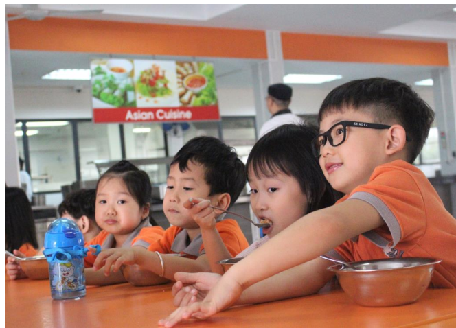
Học sinh lớp Prep đến từ các trường mầm non cùng hệ thống KinderWorld đến thăm trường