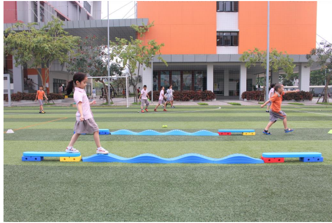
Trong học phần này, Nhà trường tổ chức Ngày hội thể thao với rất nhiều hoạt động thú vị dành cho học sinh