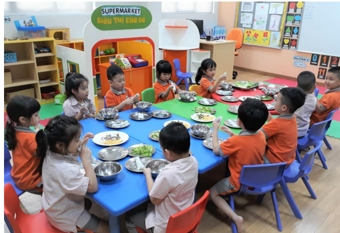
Học sinh KIK làm món Phở Cuốn