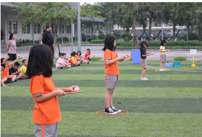
Trò chơi Quả trứng và Vợt bóng bàn luôn đòi hỏi tốc độ và sự khéo léo