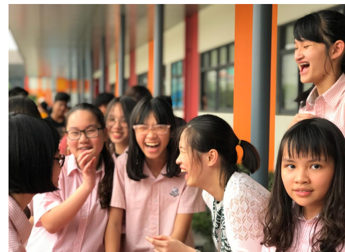
Học sinh lớp 7 song ngữ đã có khoảng thời gian vui vẻ với các bạn và cô GVCN