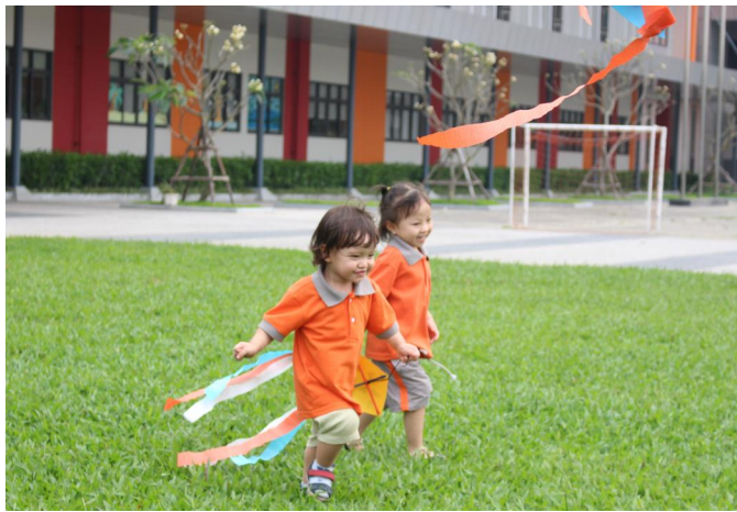
Học sinh KIK với các tiết học vui chơi ngoài trời, các em đang chơi với điều.