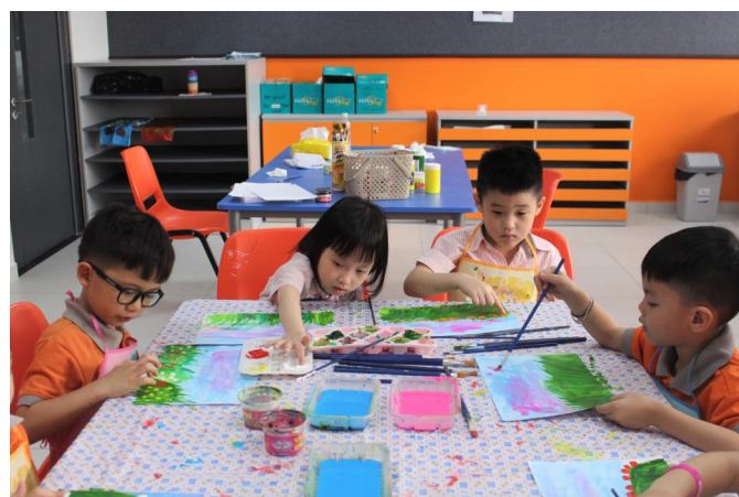
Các em học sinh Prep được tham gia tiết học Mỹ thuật thú vị

tiếp tục nhận được sự chia sẻ, chung tay ủng hộ và đồng hành của Quý CMHS trong hoạt động Tri ân thương binh Duyệt tiên của thầy trò nhà trường!