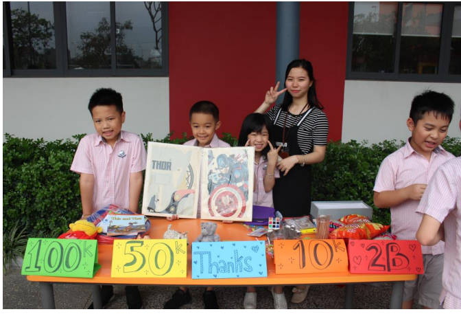
Gian hàng của học sinh lớp 2 với những trò chơi vui nhộn

ngữ. Trong Học phần này, chúng tôi hi vọng các học sinh quyên góp những cuốn sách các em đã đọc cho thư viện Tiểu học hoặc thư viện Trung học. Cụ thể, chúng tôi muốn bắt đầu nhận sách bằng tiếng Hàn để học sinh có thể được đọc miễn phí và trường sẽ bổ sung thêm sách tiếng Hàn cho năm học tới. Sách được quyên góp sẽ được đưa vào hệ thống thư viện để học sinh có thể mượn và trả sách thường xuyên. Những cuốn sách này cũng có thông tin về người quyên tặng. Học sinh có thể mang sách xuống văn phòng trường, hoặc đưa sách cho giáo viên chủ nhiệm lớp.