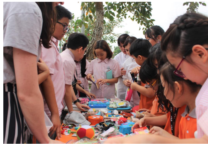
Học sinh tham gia bán hàng và mua nhiều vật phẩm trong hội chợ SIS Flea Market

Để tôn vinh tất cả các ngôn ngữ mẹ đẻ mà học sinh SIS sử dụng, chúng tôi sẽ nhận quyên góp cho thư viện các sách bằng nhiều ngôn