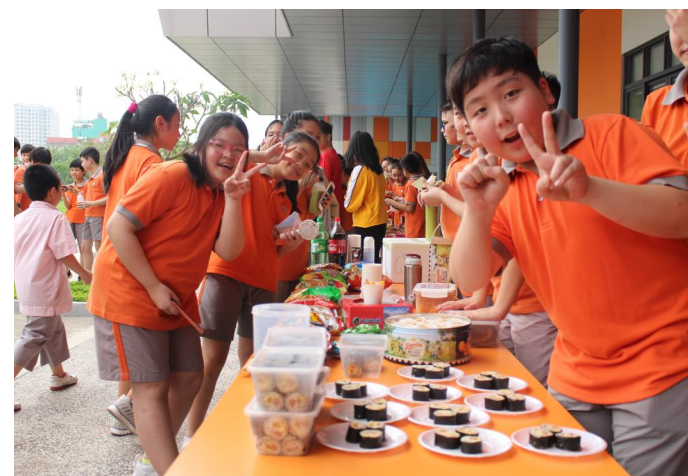
Có rất nhiều lớp trưng bày các gian hàng bán đồ ăn rất ngon!