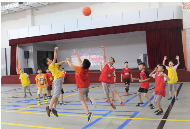
Một trận đấu bóng rổ nhiệt huyết của học sinh.