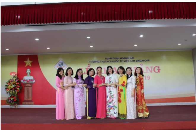
Các cô giáo xinh đẹp trong tà áo dài truyền thống