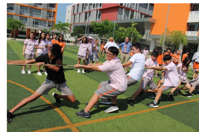
Trò chơi kéo co của các em học sinh khối THPT trong Lễ hội Trung thu 2018

Mục tiêu giáo dục của trường SIS@Gamuda Gardens là đào tạo nên những công dân toàn cầu và có kiến thức. Chúng ta cũng biết rằng “Đọc sách là chìa khóa dẫn đến thành công trong học tập”. Phụ huynh cần khuyến khích các em đọc nhiều sách hơn nữa bằng việc tích cực đọc sách tại thư viện trường và mua sách để các em đọc ở nhà. Các em cần được ấn định thời gian đọc sách, đặc biệt là thời gian đọc sách ở nhà và thời gian đọc trên thư viện trường. Đó là cách tuyệt vời để xây dựng niềm yêu thích đọc sách cho các em. Tuyệt vời hơn nữa nếu cha mẹ có thể cùng đọc sách với con, điều này sẽ giúp ích rất nhiều cho con đường học tập của các con trong tương lai.