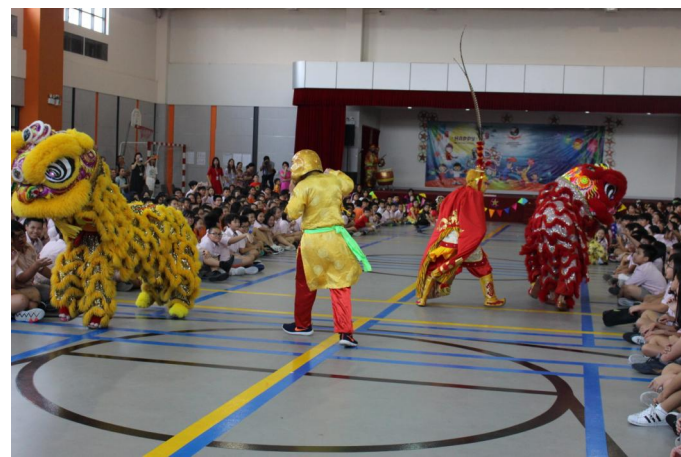
Màn múa lân truyền thống trong Lễ hội Trung thu 2018