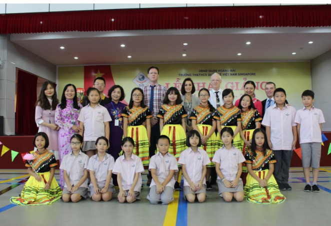
Các thầy cô giáo cùng các em học sinh trong Lễ khai giảng năm học mới