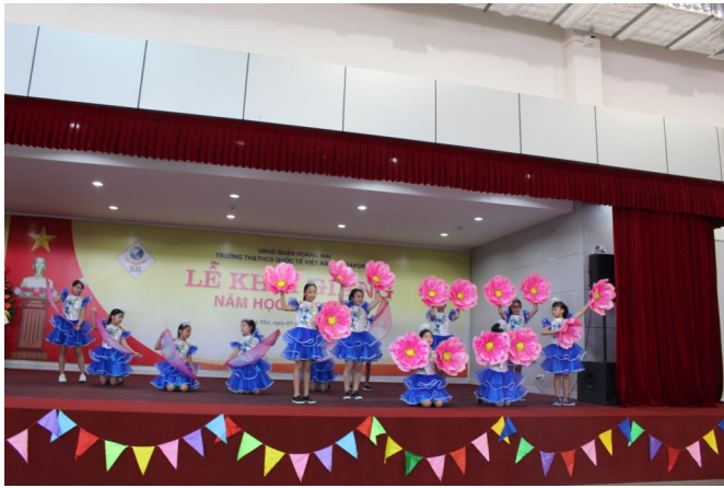
Một tiết mục biểu diễn văn nghệ của các em học sinh trong Lễ khai giảng năm học mới