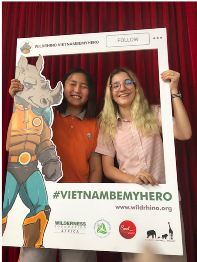
Các em học sinh chụp ảnh lưu niệm trong khung hình Tê giác

lớp học của các em; Quý Phụ huynh đừng quên hỏi các em về các sản phẩm được trưng bày tại lớp học trong buổi Họp Phụ huynh sắp tới!