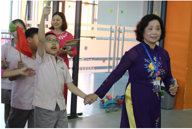
Cô Nghị cùng các em học sinh trong Lễ khai giảng năm học mới