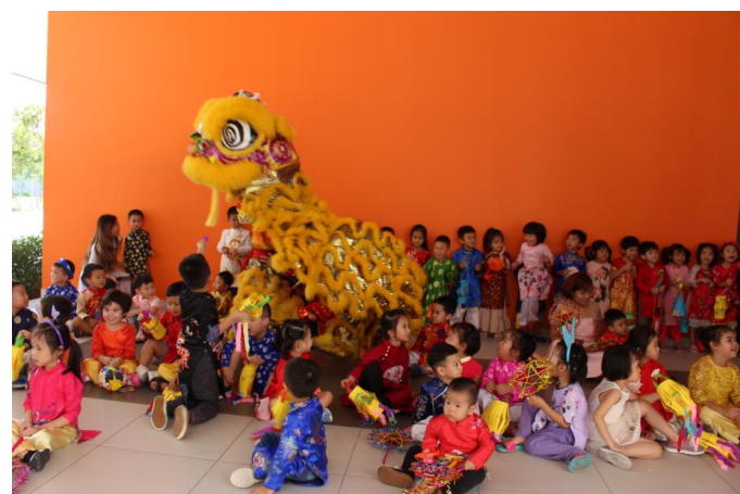
Màn múa lân truyền thống trong Lễ hội Trung thu 2018

Quý Phụ huynh nên hỗ trợ con em mình học tập ở nhà. Kiểm tra bài vở của con hoàn thành hay chưa và nhắc nhở con chuẩn bị bài cho ngày hôm sau. Cha mẹ, học sinh và giáo viên cần trao đổi thường xuyên để đảm bảo sự tiến bộ của học sinh, không chỉ ở trường mà còn trong cuộc sống.