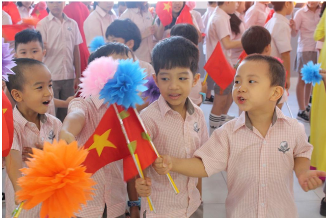
Các em học sinh hân hoan trong Lễ khai giảng năm học mới