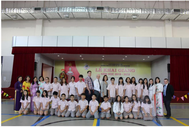
Các thầy cô giáo cùng các em học sinh trong Lễ khai giảng năm học mới