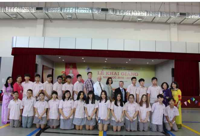
Các thầy cô giáo cùng các em học sinh trong Lễ khai giảng năm học mới