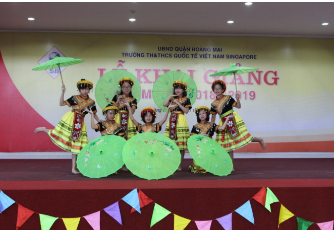
Một tiết mục biểu diễn văn nghệ của các em học sinh trong Lễ khai giảng năm học mới