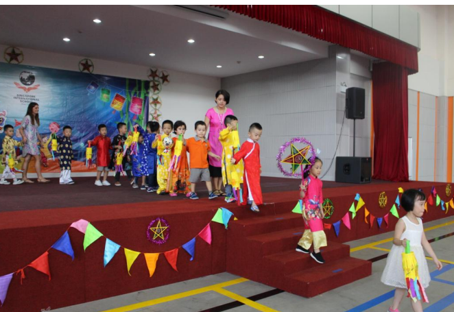
Lễ rước đèn Trung thu của các em học sinh