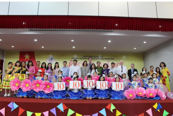
Các thầy cô giáo cùng các em học sinh trong Lễ khai giảng năm học mới

có những cuộc thảo luận mang tính xây dựng từ phía phụ huynh về việc “Làm cách nào để hỗ trợ các con trong việc học tại trường”.