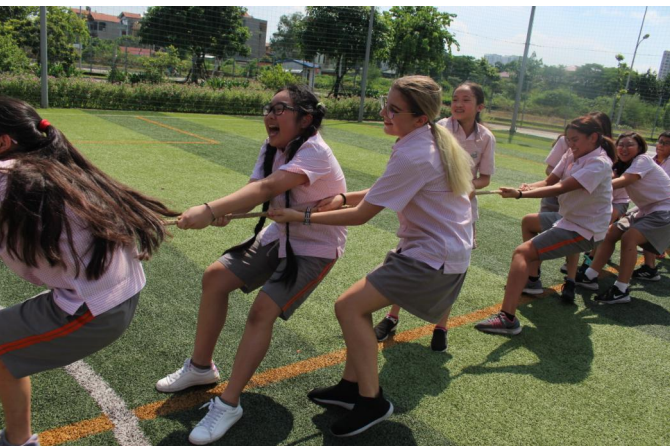
Trò chơi kéo co của các em học sinh khối THCS trong Lễ hội Trung thu 2018