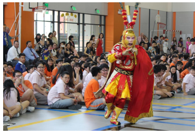
Màn múa lân truyền thống trong Lễ hội Trung thu 2018