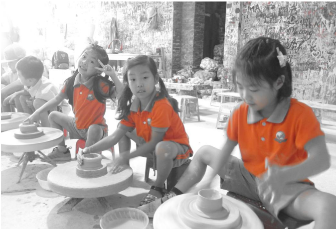
Chuyến dã ngoại của các em học sinh lớp 1L tới Làng gốm Bát Tràng