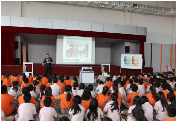
Bài diễn thuyết của đại diện Tổ chức Tê giác trắng