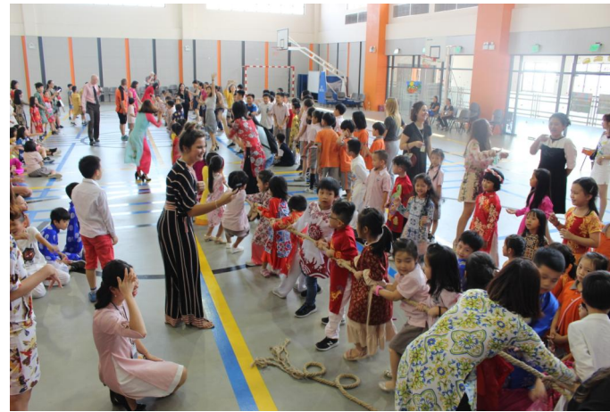
Trò chơi kéo co của các em học sinh Tiểu học trong Lễ hội Trung thu 2018