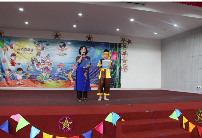
Cô Nghị phát biểu mở màn Lễ hội Trăng rằm 2018

Nhằm giúp CMHS nắm được lịch thi HKI và thu xếp cho con đi du lịch không bị trùng vào thời gian thi trên, ban Giám hiệu gửi tới Quý vị Lịch Thi học kì I của học sinh SVIS như sau: