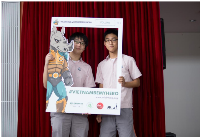
Các em học sinh chụp ảnh lưu niệm trong khung hình Tê giác