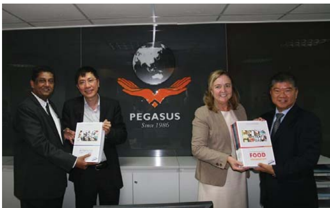
ESRT trao tài liệu VTOS phiên bản 2013 cho Pegasus

Cũng trong tháng Năm, Pegasus đã có đề xuất hợp tác với Cục Ngoại vụ thuộc Bộ ngoại giao về việc cung cấp các khóa bồi dưỡng Tiếng Anh dành cho Lãnh đạo và cán bộ các cơ quan ngoại vụ địa phương.