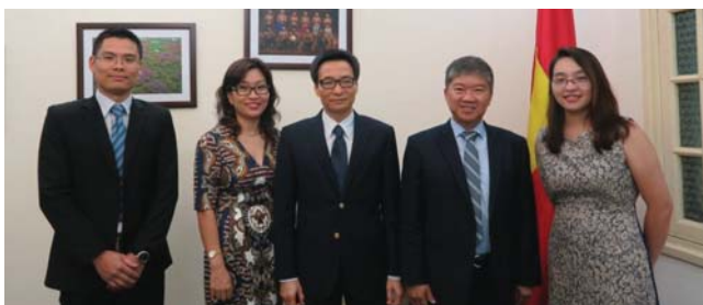
Cuộc họp với Phó Thủ tướng Vũ Đức Đam, tháng 6 năm 2016 tại Hà Nội