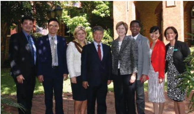
Cuộc họp với trường TAFE New South Wales, 23 tháng 11 năm 2016