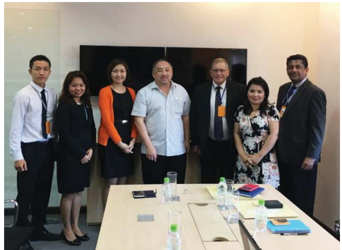
Lãnh đạo trường Cao đẳng Quốc tế Pegasus và đại diện đến từ SIM, tháng 10 năm 2016 tại Đà Nẵng