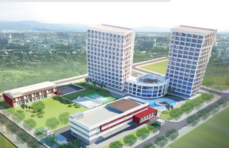
Phối cảnh của Trường Cao đẳng Quốc tế Pegasus tại Phú Quốc

Sau khi có được Giấy Chứng nhận Quyền Sử dụng đất vào tháng 1/2016, Dự án Khu Phức hợp Du lịch Sinh thái Pegasus tại Bình Định đang tích cực triển khai xây dựng hạ tầng. Hiện tại, Dự án đã có kho lưu trữ trang thiết bị và văn phòng tạm thời. Tới Quý 1/2017, Giai đoạn 1 của Dự án sẽ được khởi công, đồng thời, sẽ bắt đầu đón học viên tới tham gia khóa học. Việc xây dựng dự kiến sẽ được hoàn thành vào Quý 1/2018, sau đó Giai đoạn 2 và 3 là Khu nghỉ dưỡng sinh thái và Khu Biệt thự cũng sẽ được tiến hành xây dựng.