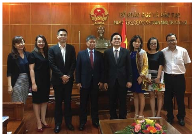
Cuộc họp với Bộ trưởng Bộ Giáo dục và Đào Tạo Phùng Xuân Nhạ, tháng 6 năm 2016 tại Hà Nội

Phó Thủ tướng và Bộ trưởng Bộ Giáo dục và Đào tạo đều thể hiện sự ủng hộ và quan tâm với đề xuất thành lập Trường Đại học Quốc tế Pegasus và hy vọng các dự án đầu tư giáo dục của Tập đoàn Giáo dục KinderWorld ngày càng phát triển hơn nữa.