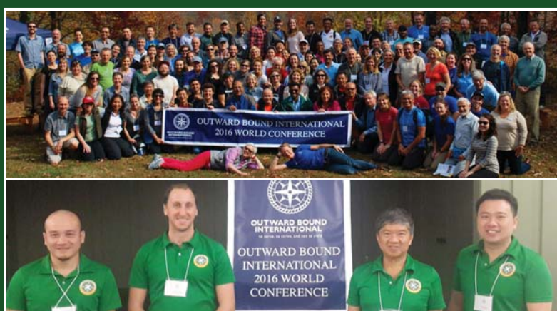
Outward Bound Việt Nam tham dự Hội nghị Outward Bound Quốc tế 2016