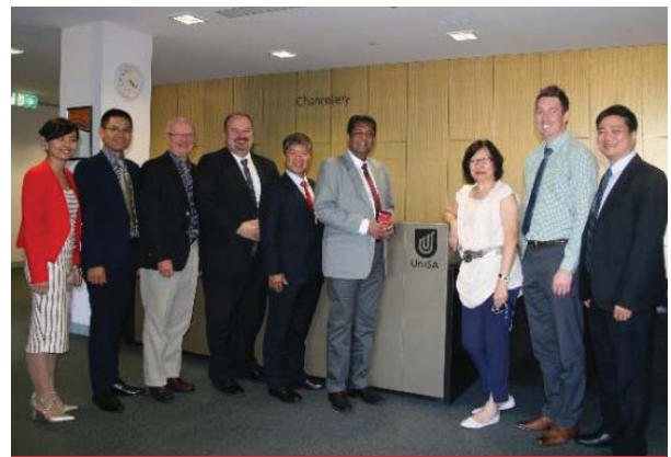
Cuộc họp với trường Đại học Nam Úc, 29 tháng 11 năm 2016