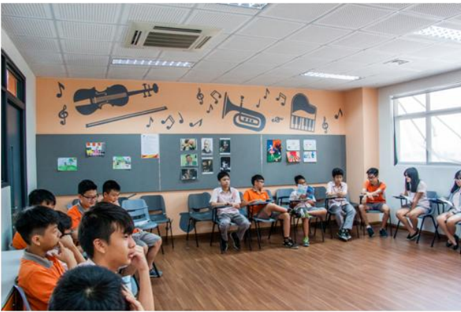
Học sinh trong phòng học nhạc