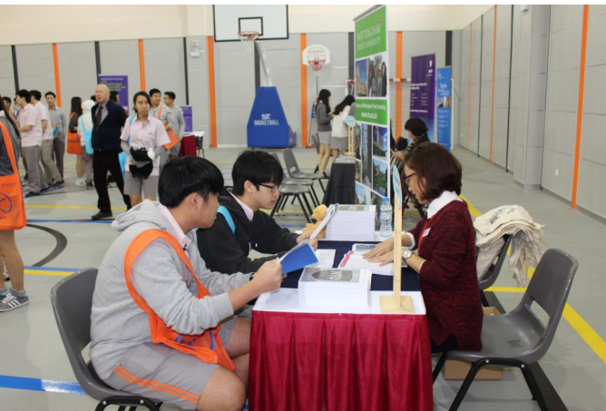
Học sinh tìm hiểu về trường đại học yêu thích trong Ngày hội Du học Anh