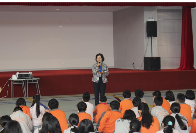
Cô Hiệu trưởng dẫn dò các em học sinh trong buổi Sinh hoạt chung