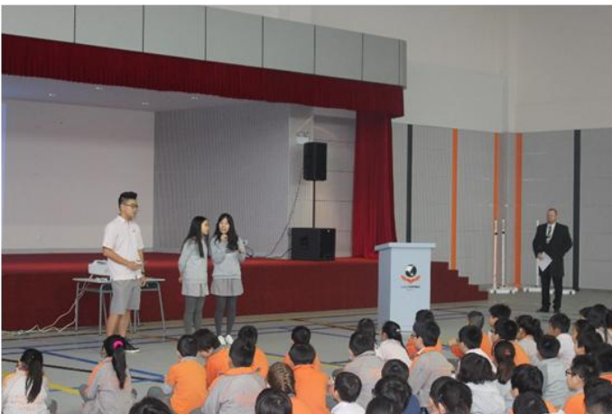
Học sinh thuyết trình trong buổi Sinh hoạt chung