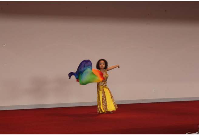
Học sinh lớp 1 biểu diễn tiết mục múa bụng