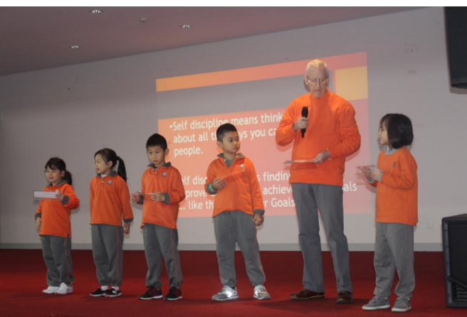
Học sinh lớp 2A thuyết trình chủ đề Đạo đức