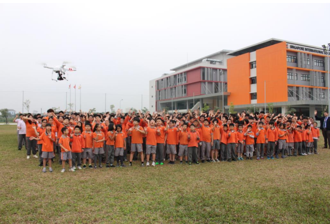
Học sinh toàn trường chụp ảnh chung