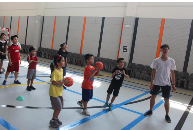
Học sinh Tiểu học chơi thể thao cùng học sinh Trung học