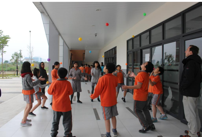
Các hoạt động của Outward Bound