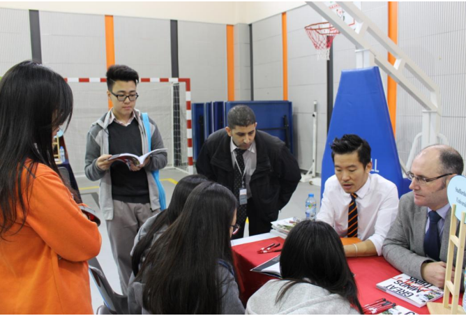
Học sinh tìm hiểu về trường đại học yêu thích trong Ngày hội Du học Anh