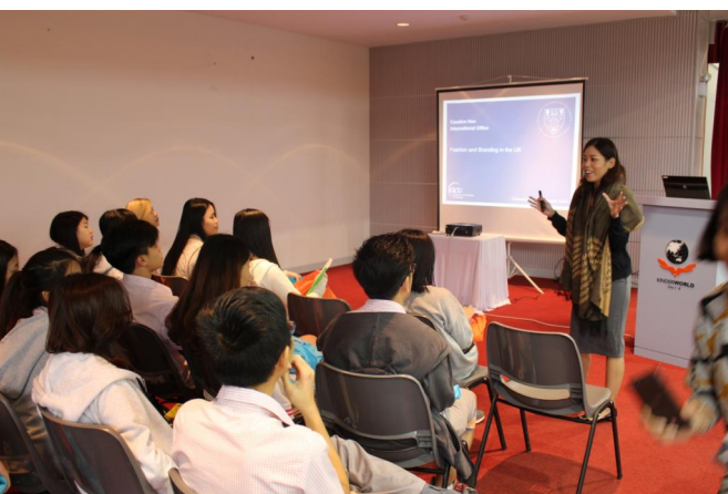
Thuyết trình giới thiệu về trường đại học trong Ngày hội Du học Anh