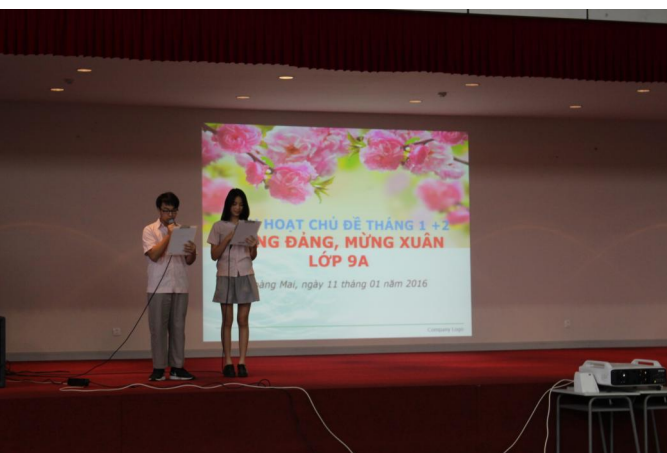
Học sinh dẫn chương trình trong buổi Sinh hoạt Chủ đề tháng 1+2