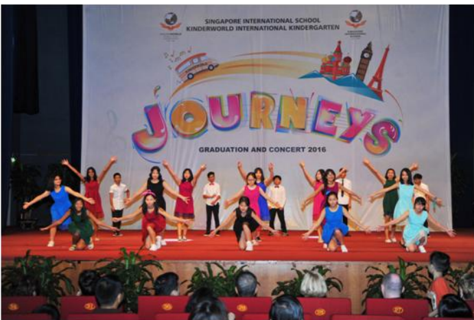
Tiết mục biểu diễn của lớp 8LB trong buổi biểu diễn văn nghệ cuối năm