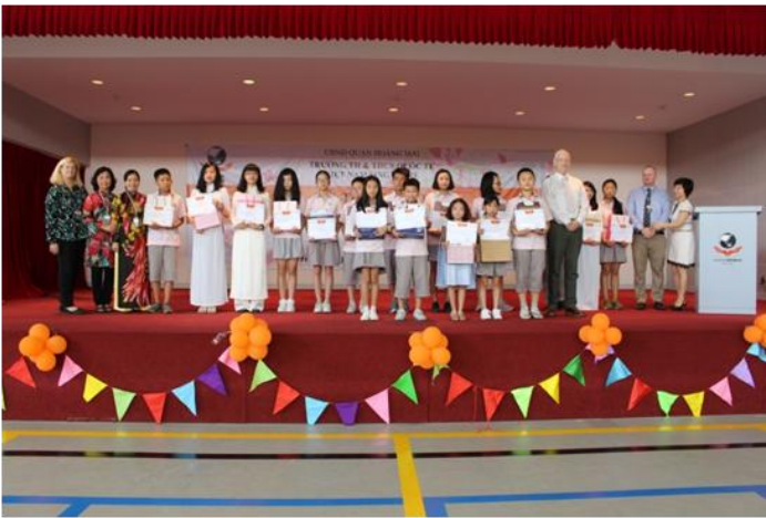
Lễ tổng kết năm học và Tốt nghiệp khối SVIS