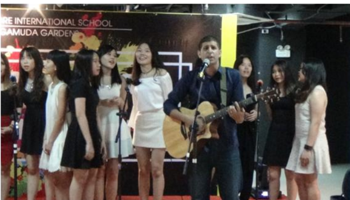
Biểu diễn văn nghệ trong Đêm Nghệ thuật

Kì nghỉ hè đã đến gần, các em cần nhớ rằng kì nghỉ cũng là khoảng thời gian quý giá để học hỏi, không chỉ trong sách vở mà còn về những bài học quý báu trong cuộc sống. Các em nên tiếp tục học tập, trau dồi trong kì nghỉ để giữ cho đầu óc luôn linh hoạt. Đây cũng là cơ hội tuyệt vời để Quý vị phụ huynh trao đổi với con em mình về những suy nghĩ, ý tưởng và sở thích của các em. Mặc dù kì nghỉ là khoảng thời gian vui chơi, giải trí nhưng có thể các em sẽ nhanh chóng cảm thấy nhàm chán. Khi Quý Phụ huynh dành thời gian bên các con, hãy cố gắng trò chuyện về cuộc sống, về sự trưởng thành, về những thay đổi so với thời thơ ấu của Quý vị, những khác biệt của thế giới ngày nay và trao đổi với các em về những gì đang diễn ra xung quanh. Quý vị hãy giúp các em mở rộng tầm mắt, để các em được đối mặt với thử thách theo nhiều cách khác nhau như việc tổ chức đi xem phim, ngủ ở nhà bạn, tìm sách mới để đọc hoặc tô màu, viết nhật kí về những sự kiện trong ngày nghỉ, đi thăm một địa danh mới, tổ chức hoặc làm những việc mà các em chưa từng làm, học làm đồ thủ công từ Internet, hay để các em lên lịch trình cho chuyến du lịch của gia đình, xây dựng các mô hình, v.v... Quý Phụ huynh cũng có thể tham gia các trò chơi với các em như trò Nim, cờ tướng, cờ triệu phú (Monopoly), chơi bài, cờ gánh (Reversi) ... để giúp các em hoàn thiện các kĩ năng giải quyết vấn đề, kĩ năng tư duy, và quan trọng hơn cả là khuyến khích các em dành ít thời gian hơn với máy vi tính.