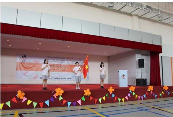
Lễ Tổng kết năm học và Tốt nghiệp khối SVIS