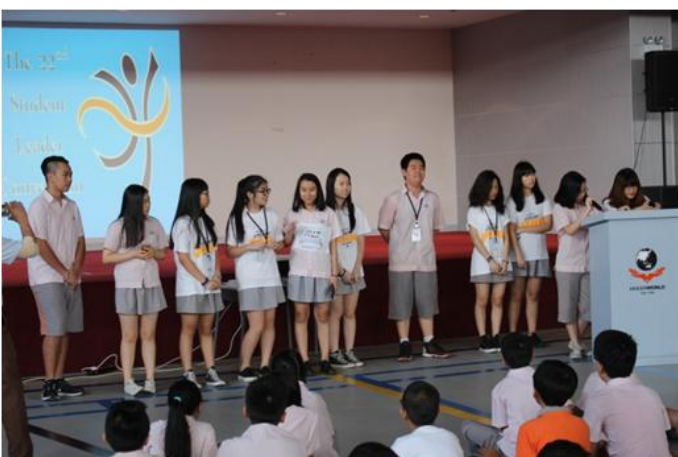
Các em học sinh chia sẻ trải nghiệm của mình tại Hội nghị các nhà Lãnh đạo trẻ lần thứ 22

Được tổ chức với chất lượng tuyệt vời, Hội nghị lần này vừa là cơ hội để các em học sinh tiếp cận tầm cao tri thức mới, đồng thời cũng là cơ hội để các giáo viên bồi dưỡng và trao đổi chuyên môn cùng các đồng nghiệp đến từ các quốc gia khác trên thế giới.