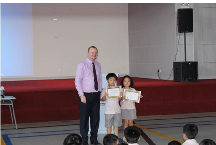
Học sinh Tiểu học nhận giấy khen từ thầy Hiệu Trưởng

Các em được nghe và chúc mừng thành tích đáng tự hào của toàn trường và của các bạn học sinh xuất sắc đã nỗ lực phấn đấu và gặt hái trong năm học vừa qua: