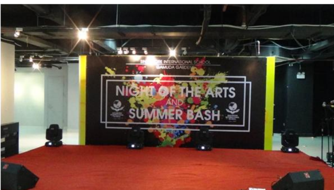
Đêm Nghệ thuật Thường niên lần thứ 7