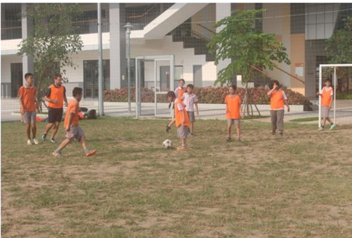
Các em học sinh chơi đá bóng trong giờ giải lao