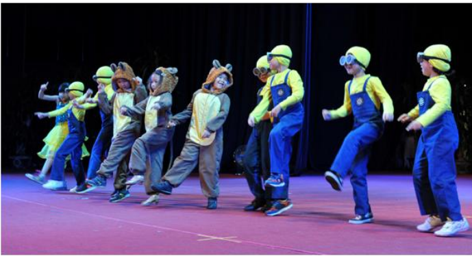
1A, 2A, 3A, 4A End of Year Concert Performance