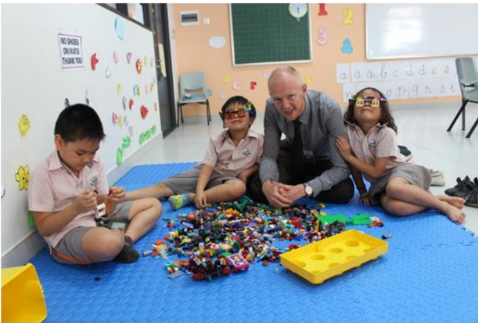
Câu lạc bộ xếp hình Lego