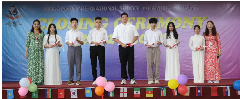
HỌC SINH KHỐI 9 CHƯƠNG TRÌNH SONG NGỮ