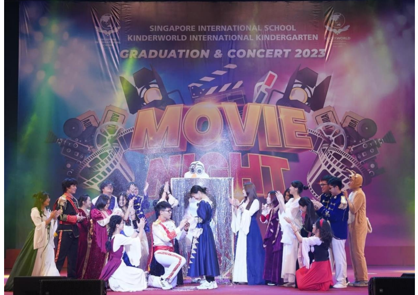
CHƯƠNG TRÌNH BIỂU DIỄN VĂN NGHỆ CUỐI NĂM