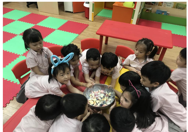
Các em đang làm sa-lát