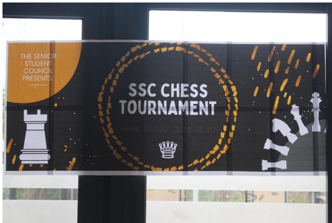
Hội Học sinh tổ chức giải đánh cờ vua