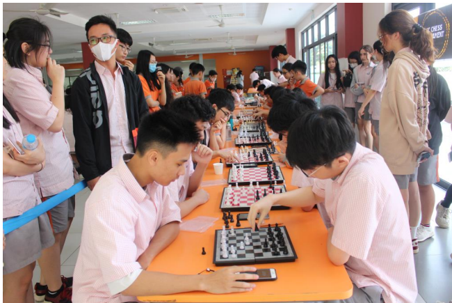
Những trận đấu rất gay cấn!