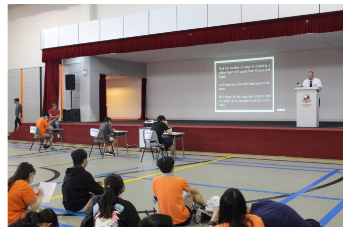
Học sinh khối Trung học Phổ thông tham gia cuộc thi Toán