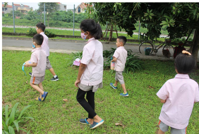
Học sinh săn trứng Phục sinh