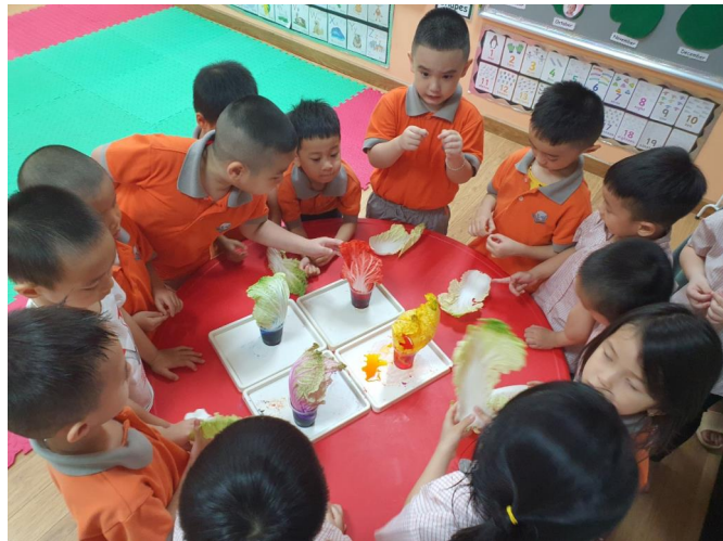
Học sinh tham gia các hoạt động STEM