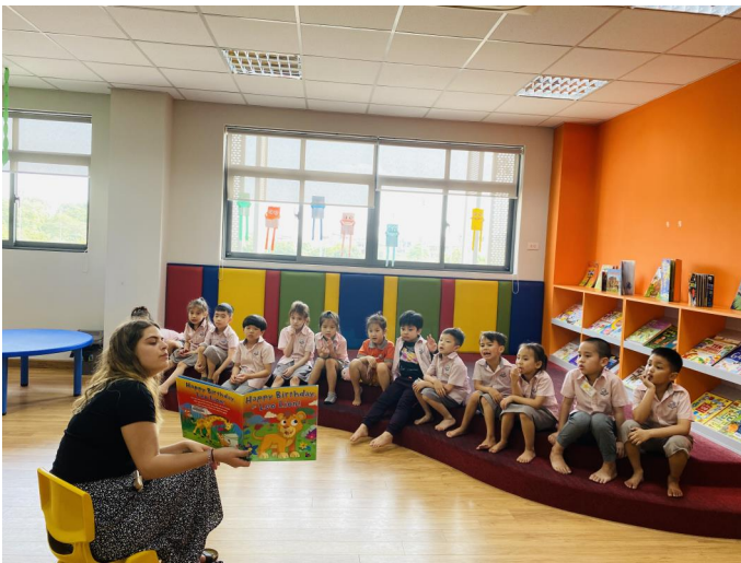
Học sinh khối Mầm non đang học tiết kể chuyện