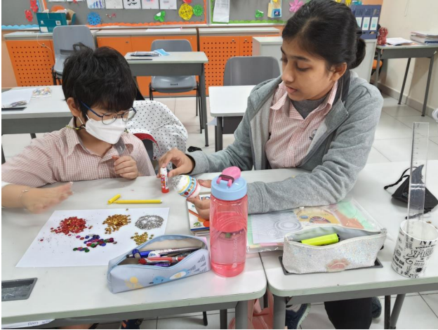
Học sinh hào hứng trang trí trứng Phục sinh