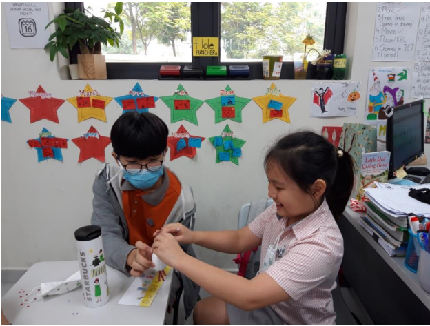
Qua hoạt động này, các em kết thêm nhiều bạn mới