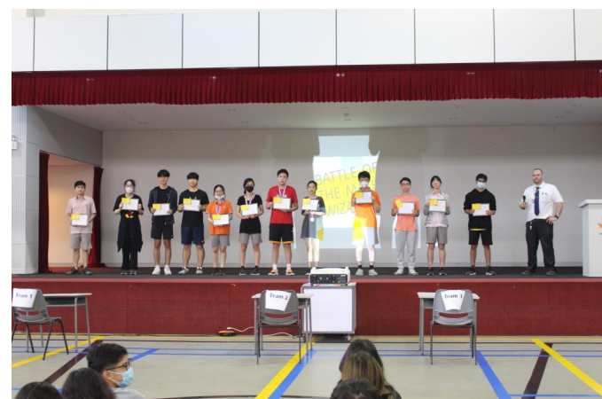
Những học sinh chiến thắng cuộc thi Toán