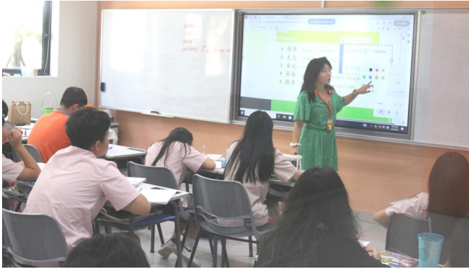
TIẾT HỌC MÔN TIẾNG TRUNG