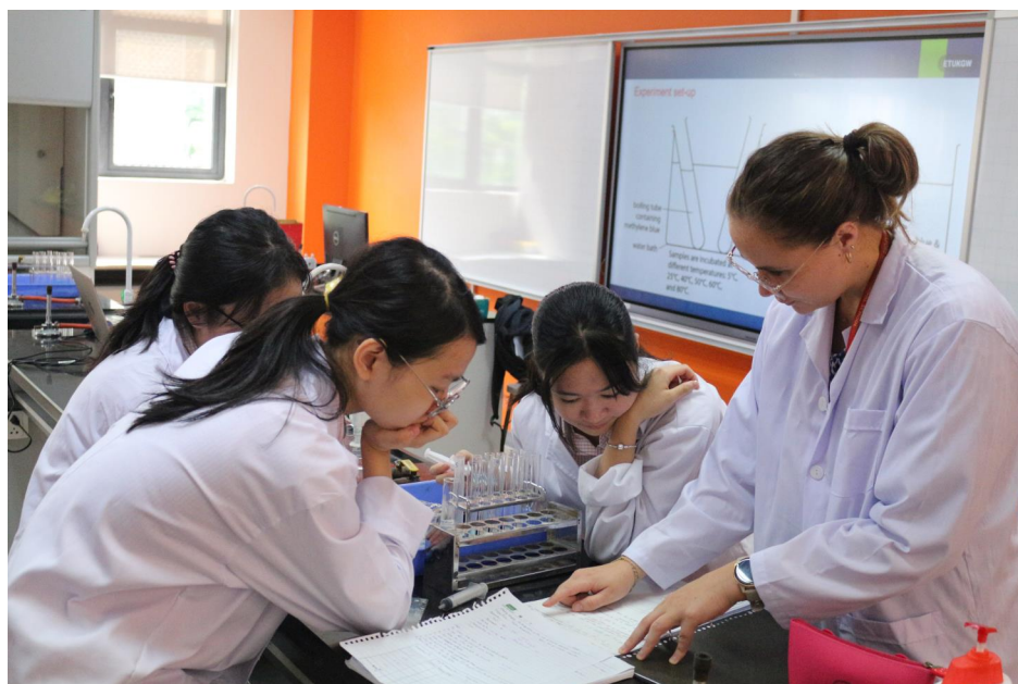
TIẾT HỌC MÔN KHOA HỌC