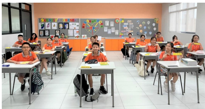
CHÀO MỪNG NĂM HỌC MỚI

Trường Quốc tế Singapore tại Gamuda Gardens