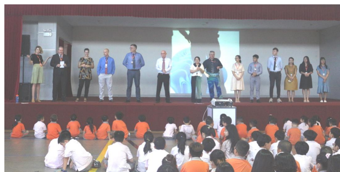
GIÁO VIÊN MỚI NĂM HỌC 2023-2024