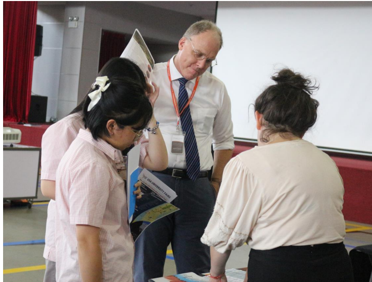
TRIỂN LÃM DU HỌC