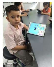
LỚP HỌC STEM