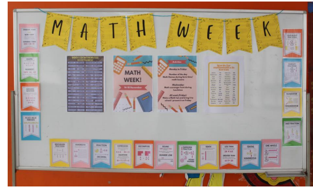
Tuần lễ Toán học SIS!