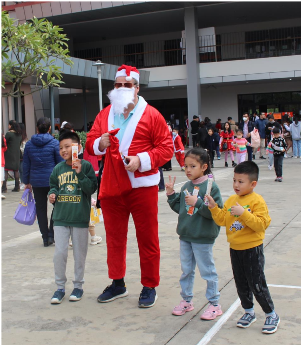
Ông già Noel đã đến!

Hiệu trưởng Trường Quốc tế Singapore, Gamuda Gardens