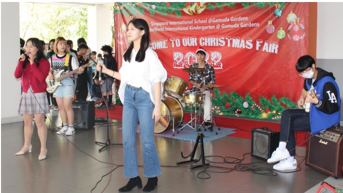
Ban nhạc Học sinh SIS