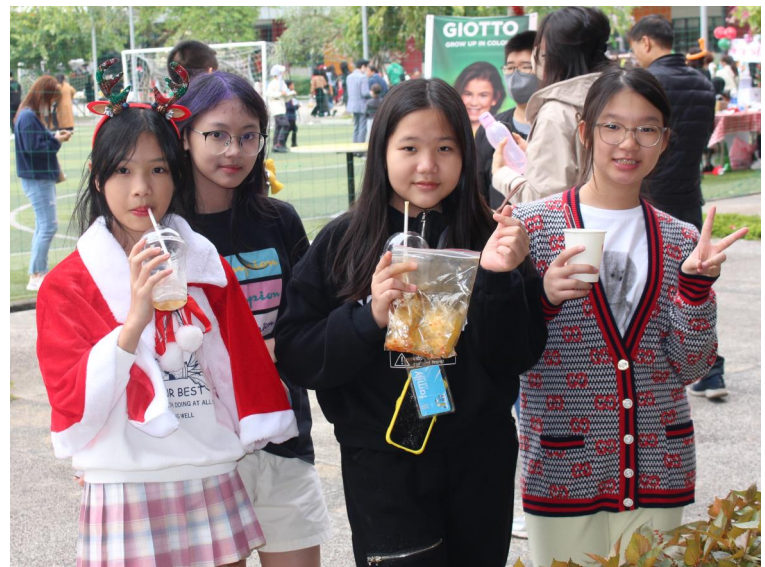
Giáng Sinh đến!