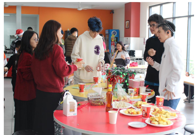
Những “doanh nhân trẻ” SIS thương lượng bán hàng.