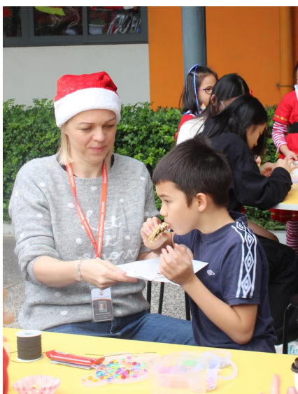
Vị của Giáng sinh