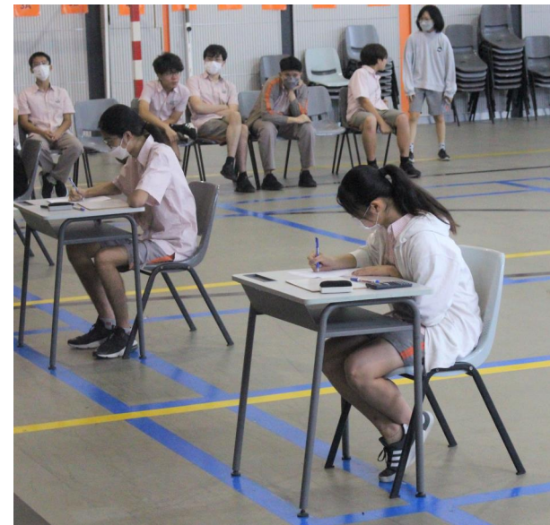
Vòng thi đấu chung kết Toán học