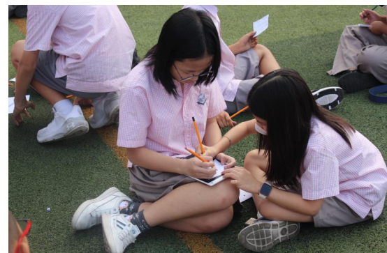
Làm việc nhóm!