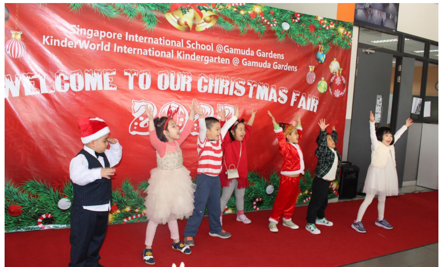
Những trợ lí bé nhỏ của Ông già Noel