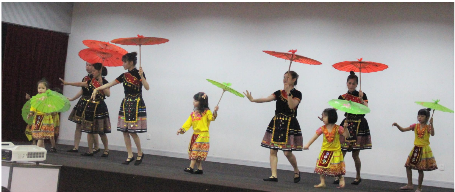
Màn biểu diễn của giáo viên và học sinh KIK