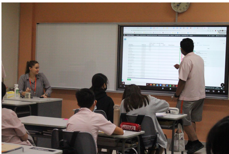
Giáo viên và Học sinh tương tác Bảng thông minh