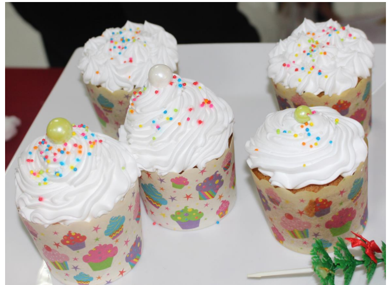
Cupcake Giáng Sinh