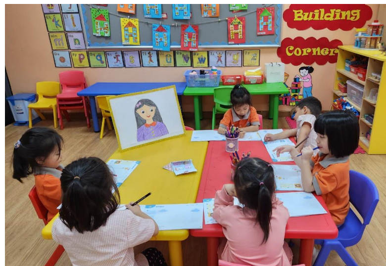
Một số hoạt động của SIS & KIK