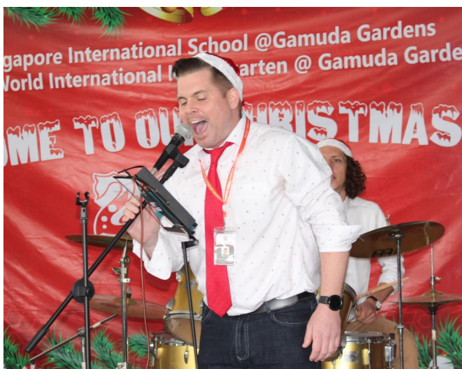
Đội ngũ giáo viên—nhân viên SIS hòa mình trong không khí Giáng Sinh.