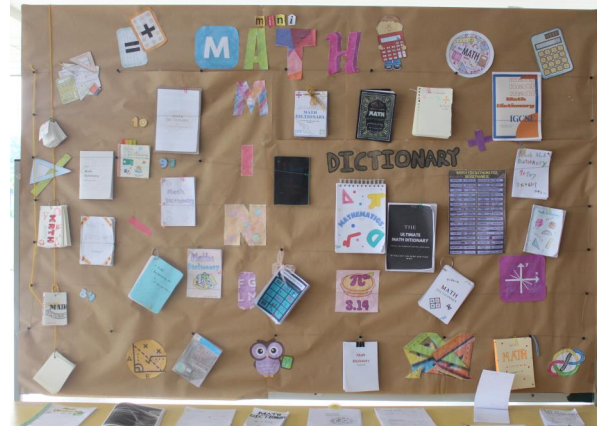
Từ điển Toán học