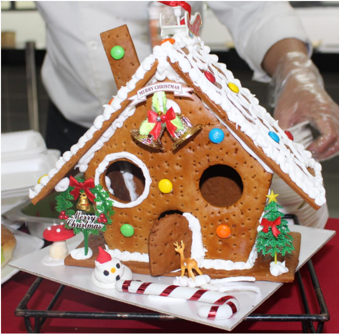
Nhà bánh gừng