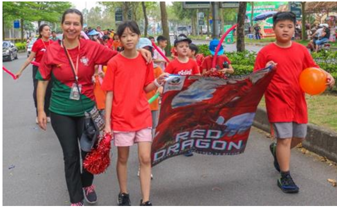
CÁC EM HỌC SINH KHÔI TIỂU HỌC HÀO HÙNG ĐIỀU HÀNH TRÊN TUYẾN PHỐ QUANH TRƯỜNG