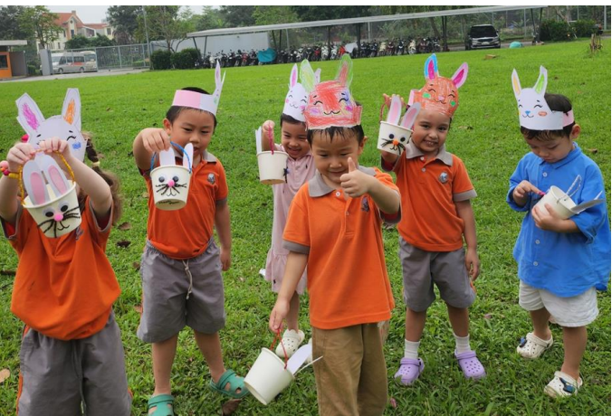
TÌM TRỨNG PHỤC SINH KHƠI GỢI TRÍ TÒ MÒ CHO CÁC EM HỌC SINH

Đường số 2, KĐT Gamuda Gardens, Km 4.4 Pháp Vân, Quận Hoàng Mai, thành phố Hà Nội