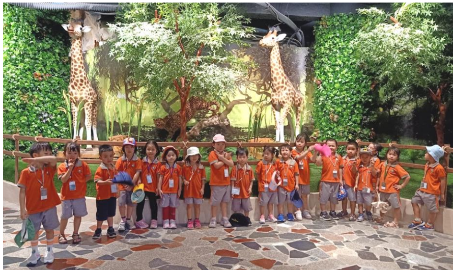
KHÁM PHÁ ĐỘNG VẬT TRONG RỪNG VỚI LỚP K2A