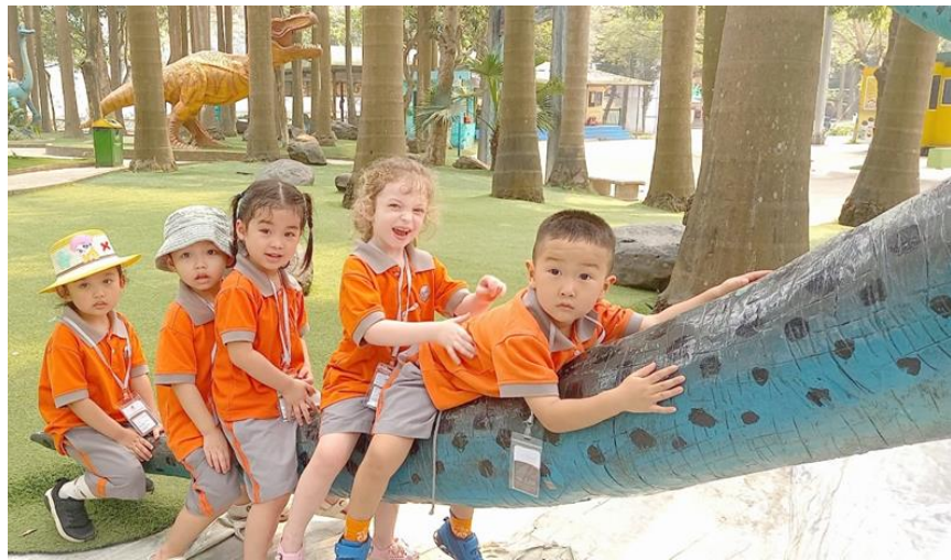
HỌC SINH LỚP K1 QUỐC TẾ CÓ NHỮNG KỈ NIỆM ĐÁNG NHỚ TRONG CHUYẾN THAM QUAN TẠI THIÊN ĐƯỜNG BẢO SƠN!