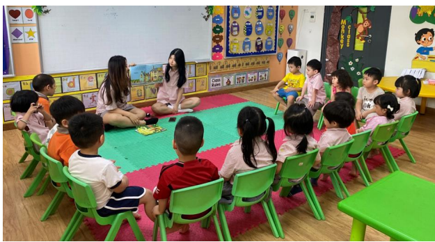
CÁC EM CHẤM CHỦ LẮNG NGHE CÁC CÂU CHUYỆN ĐƯỢC HỌC SINH KHỎI AS LEVEL KỂ VÀO CHIỀU THỨ SÁU HÀNG TUẦN