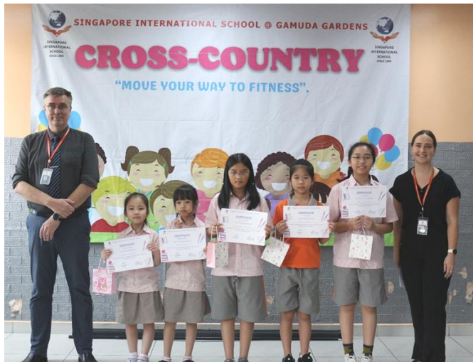
CHÚC MỪNG CÁC EM HỌC SINH ĐẠT GIẢI CUỘC THI THIẾT KẾ BÌA SÁCH.