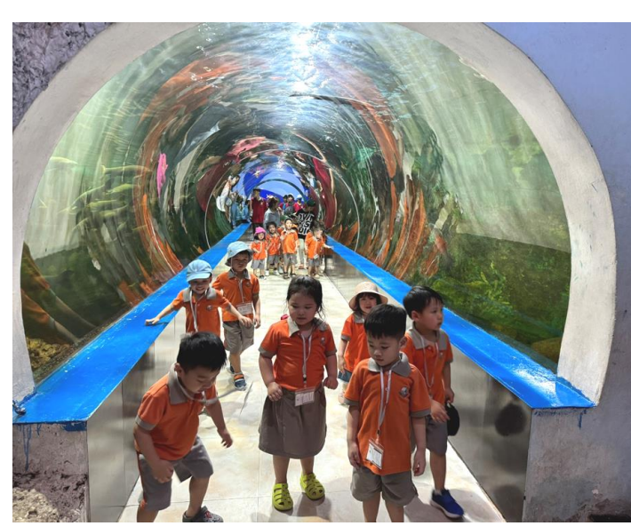
CÙNG KHÁM PHÁ THỦY CUNG VỚI LỚP K1A!