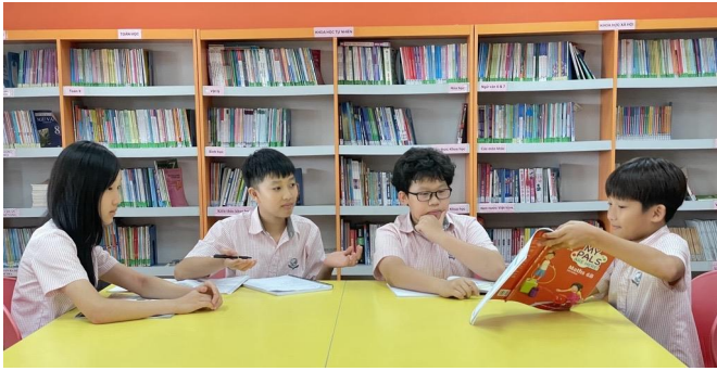
HỌC SINH HỌC NHÓM MÔN TIẾNG ANH