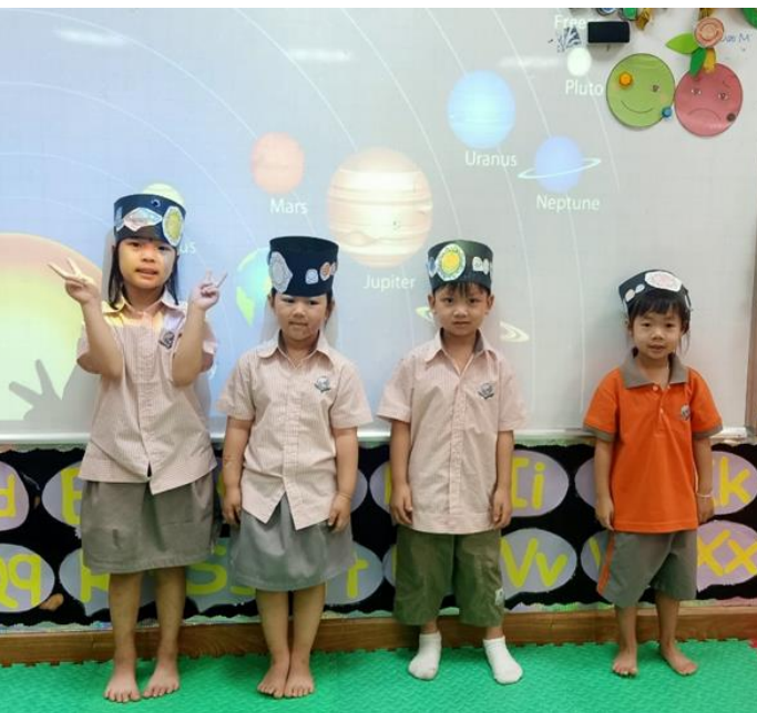
MÔ HÌNH HỆ MẶT TRỜI LUÔN THU HÚT SỰ CHÚ Ý CỦA CÁC EM HỌC SINH

Học phần 3. Các em đã tham gia hoạt động vẽ trứng đầy màu sắc, đi tìm trứng, trò chơi truyền trứng cũng như tô màu và xây nhà cho thỏ trong ngày Lễ Phục Sinh. Chủ đề học tập tháng 4 cũng khơi gợi và kích thích trí tò mò của các em khi khám phá các hành tinh, Trái đất và trải nghiệm trở thành một phi hành gia. Các em hiểu “Mặt trời là nguồn nhiệt và ánh sáng chính trên Trái đất. Nếu không có Mặt trời, con người sẽ không tồn tại trên hành tinh này. Vậy, làm thế nào để bảo vệ Trái đất xinh đẹp của chúng ta?”