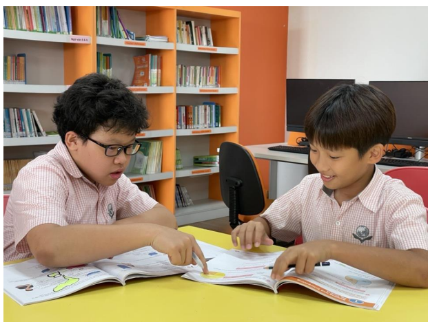
ÔN TẬP BÀI VỚI BẠN CÙNG LỚP