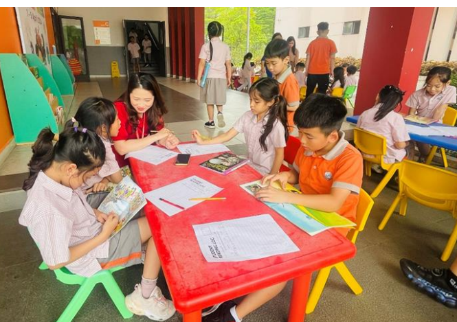
CÁC EM HỌC SINH KHỐI 2 THÍCH THÚ ĐỌC SÁCH NGOÀI TRỜI VÀ HOÀN THÀNH PHIẾU LUYỆN ĐỌC NHƯ TIỀN SĨ SEUSS ĐÃ TỪNG NÓI: “CÁC EM CÀNG ĐỌC NHIỀU, CÁC EM CÀNG HIỂU BIẾT NHIỀU. CÁC EM CÀNG HỌC NHIỀU, CÁC EM CÀNG CÓ THỂ THĂM THỬ NHIỀU NƠI.”