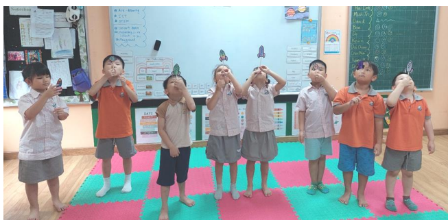
CÁC EM HỌC SINH HÀO HỨNG LÀM TÀU KHÔNG GIAN