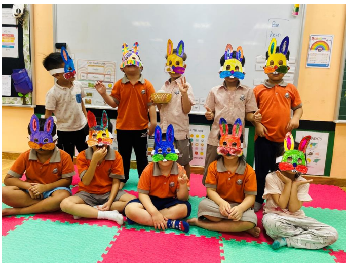
LÀM MẶT NẠ THỎ THẬT LÀ VUI!