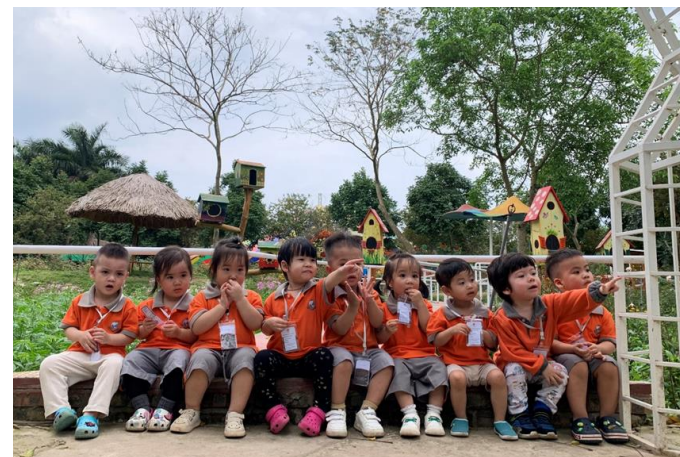
HỌC SINH LỚP NHÀ TRẺ TẬN HƯỞNG THỜI GIAN BÊN NHAU TẠI NÔNG TRẠI VẠN AN