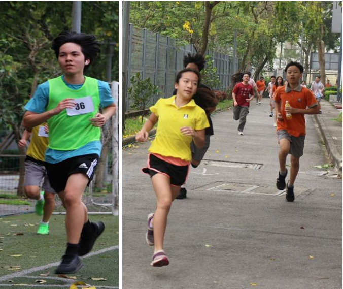
HỌC SINH KHÔI THCS VÀ THPT BỨT PHÁ TRONG CUỘC ĐUA KÌ THÚ CÁC CẤP