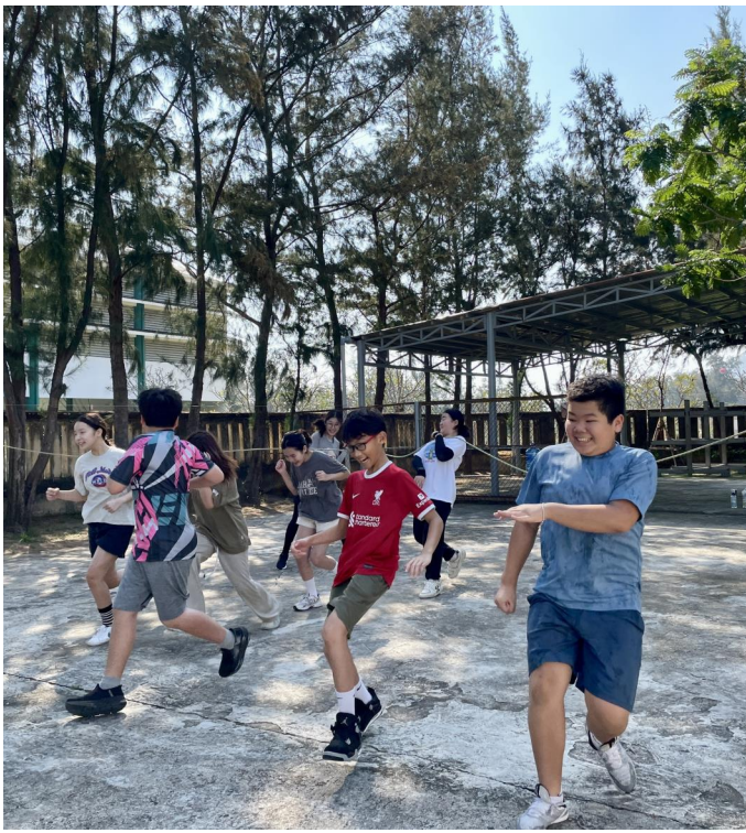
THỬ THÁCH NHẢY DÂY