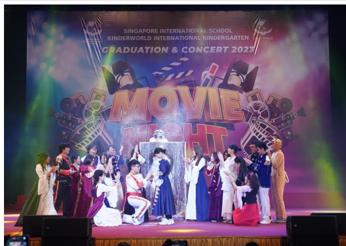
LỚP IGCSE 2A — TÁC PHẨM: FROZEN