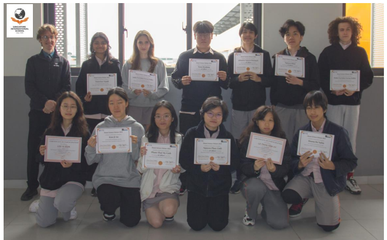
ĐỘI TUYỂN TRANH BIỆN KHOA HỌC 2024