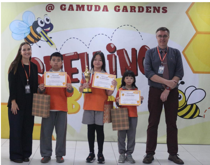
TOP 3 CUỘC THI SPELLING BEE KHỐI TIỂU HỌC SONG NGỮ