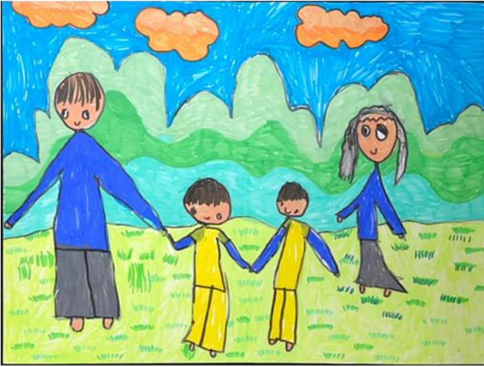
SHING HONG 1A