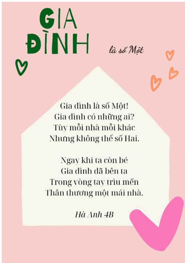
TRẦN HẠ ANH 4B