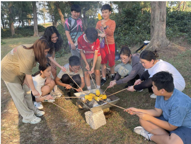
TRẢI NGHIỆM NẤU ĂN NGOÀI TRỜI