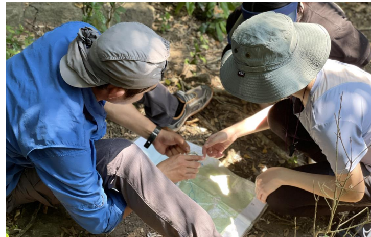
THỬ THÁCH ĐỊNH HƯỚNG VÀ TÌM PHƯƠNG HƯỚNG