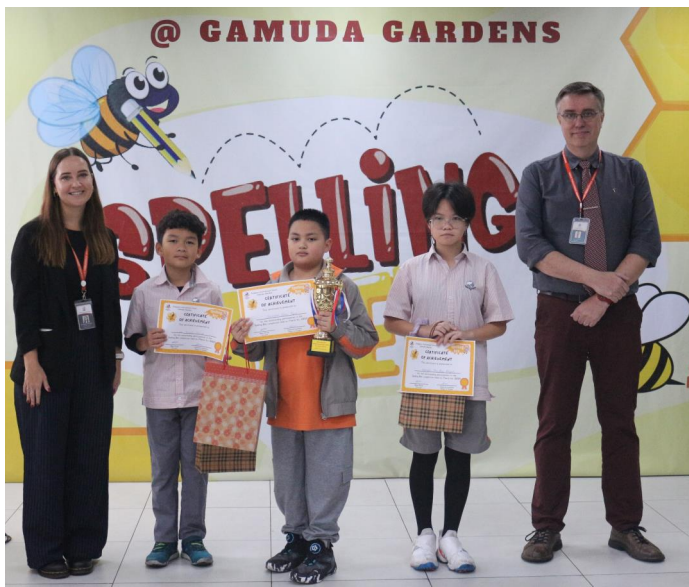
TOP 3 CUỘC THI SPELLING BEE KHỐI TIỂU HỌC QUỐC TẾ