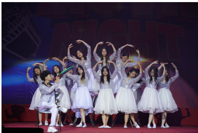
LỚP IGCSE 1A