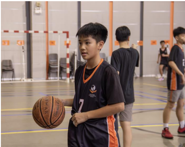
ĐỘI BÓNG RỔ THCS TRONG TRẬN ĐẤU VỚI TRƯỜNG TH