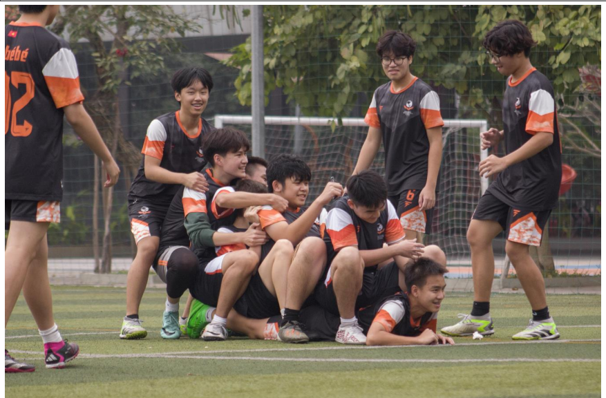
ĐỘI BÓNG ĐÁ THPT CÓ NHỮNG GIÂY PHÚT VUI VẺ