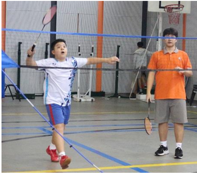
GIẢI ĐẤU CẦU LÔNG THCS HỌC SINH THUẬN PHÚC LỚP 7A THỂ HIỆN KỸ NĂNG TRÊN SÂN ĐẤU