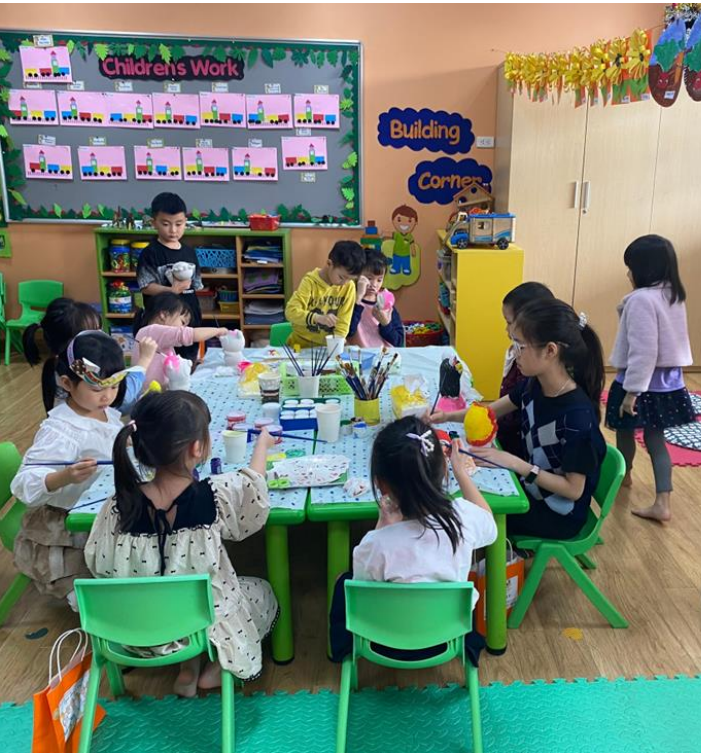
CÁC NGHỆ SĨ NHÍ ĐANG VUI VẺ TÔ TƯỢNG