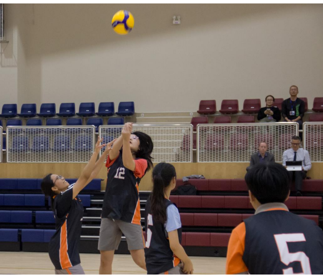
ĐỘI BÓNG CHUYỀN THPT