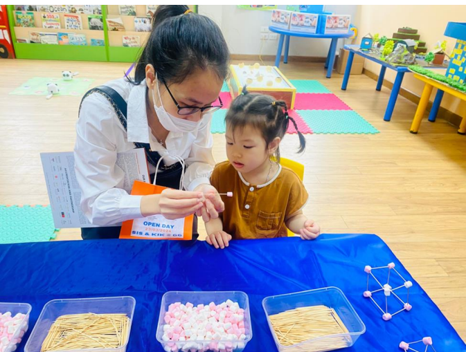
SỰ KẾT HỢP GIỮA KẸO DẸO XỐP VÀ TĂM TRE ĐỂ TẠO RA MÔ HÌNH

Đường số 2, KĐT Gamuda Gardens, Km 4.4 Pháp Vân, Quận Hoàng Mai, thành phố Hà Nội