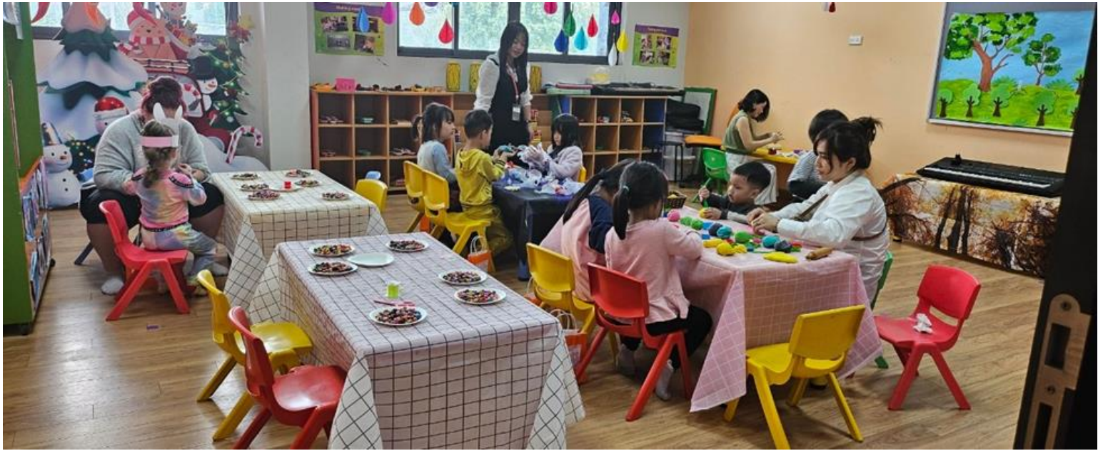
NHỮNG BÀN TAY NHỎ BÉ ĐANG TẬP TRUNG XÂU VÒNG VÀ LÀM ĐẤT NẶN THỦ CÔNG