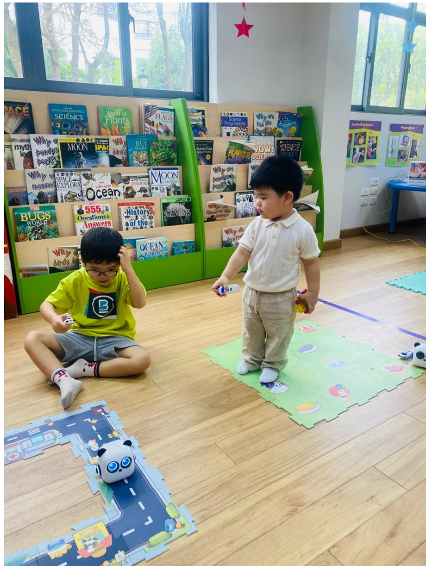
CÁC EM TRẢI NGHIỆM NIỀM VUI VỚI RÔ-BỐT

CON THÍCH NHỮNG CHIẾC BÁNH QUY ĐẸP MÀU SẮC! HÃY TRANG TRÍ BÁNH QUY THÔI.