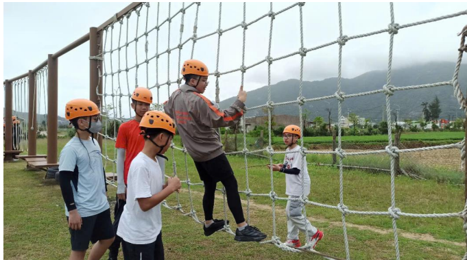
HỌC SINH KHỐI 7 QUỐC TẾ