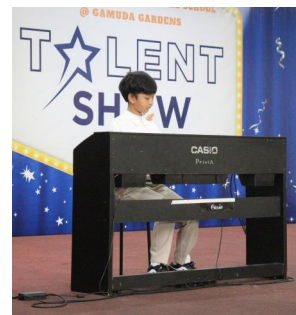
CÁC TIẾT MỤC BIỂU DIỄN TẠI CHƯƠNG TRÌNH "TÌM KIẾM TÀI NĂNG SIS 2025"

Đường số 2, KĐT Gamuda Gardens, Km 4.4 Pháp Vân, Quận Hoàng Mai, thành phố Hà Nội