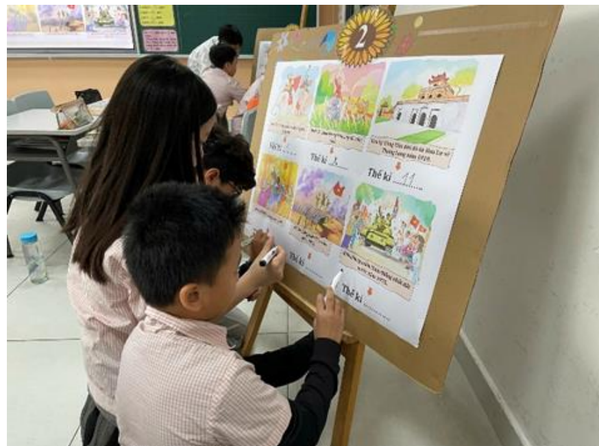
HỌC TOÁN QUA CÁC SỰ KIỆN LỊCH SỬ