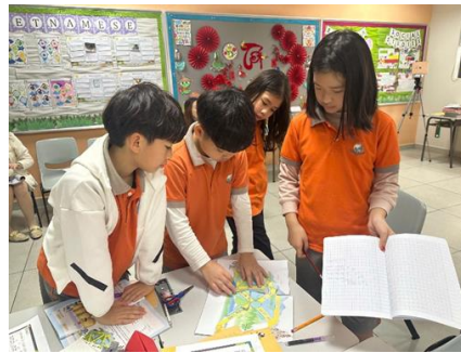
THỬ THÁCH TÌM ĐƯỜNG