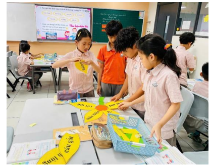
BÔNG HOA TỪ NGỮ