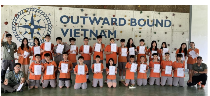
HỌC SINH KHỐI 7 SONG NGỮ